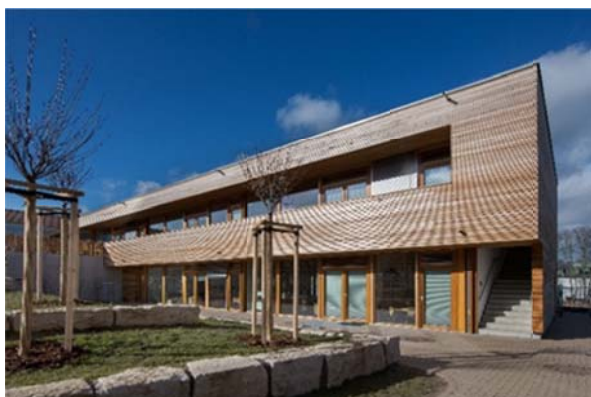
Abb. 6: Erster Preis: Hanni Kipp – Haus des Kindes, Stadt Alzey

Die Stadt Alzey hat mit ihren beiden jüngst realisierten Holzbauprojekten, der Kita „Bunte Töne“ (Abb. 5) und der Kita „Hanni Kipp – Haus des Kindes“ (Abb. 6), eine bewusste politische Entscheidung für die vermehrte Holzverwendung im öffentlichen Bauwesen getroffen.