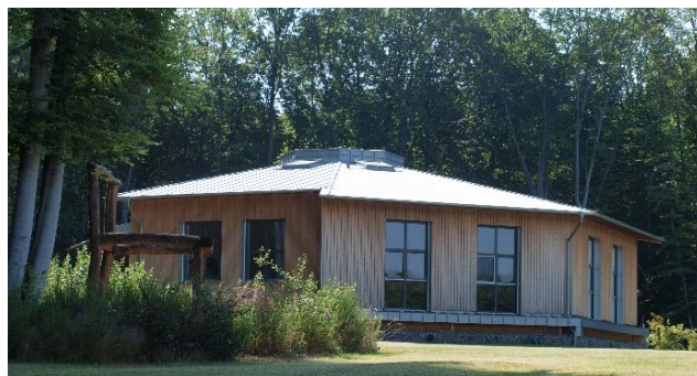
Abb. 11: Umweltlernschule Plus, Landkreis Ahrweiler

Die Umweltlernschule Plus des Landkreises Ahrweiler (Abb. 11) versteht sich als Baustein des umfassenden gesellschaftspolitischen Bildungskonzepts „Bildung für nachhaltige Entwicklung.“ Als außerschulischer Lernort begeistert die Umweltlernschule junge Menschen für die Themen Ressourcenverantwortung, Nachhaltigkeit, Holznutzung und Klimaschutz und ist zugleich ein Musterbeispiel des Kaskadennutzungsprinzips.