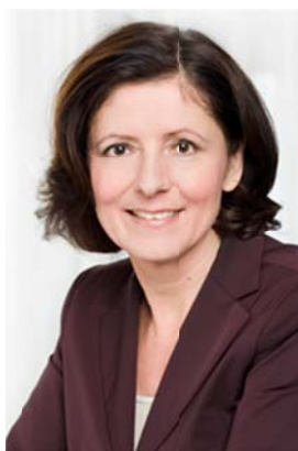
Malu Dreyer Ministerpräsidentin in Rheinland-Pfalz

„Für Rheinland-Pfalz als walddreichstes Bundesland spielt der verantwortungsvolle Umgang mit Holz eine besondere Rolle. Gerne habe ich daher die Schirmherrschaft übernommen, wenn vorbildliche Beispiele für eine gewinnbringende Verknüpfung gesucht werden: Wer den Nachhaltigkeitsrohstoff der Zukunft effizient zum Bauen und Wohnen einzusetzen versteht, erhält nicht nur langlebige Holzprodukte, sondern leistet einen aktiven und wertvollen