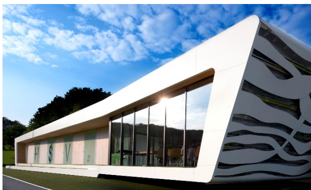
Abb. 9: Experimentalbau HSV 21, Verbandsgemeinde Wallmerod

In einem ersten Schritt wurden in öffentlichen Ausschreibungen Sondervorschläge und Nebenangebote zur Ausführung in Holz zugelassen und beauftragt. Auf Grund der positiven Erfahrungen wurden in einem weiteren Schritt zahlreiche Maßnahmen direkt als Holzbaukonstruktion ausgeschrieben. Projekte wie der „Werkstoffübergreifende Experimentalbau – HSV21“ (Abb. 9) oder das Sonnenschutz-System „SUN-Tripod“ stehen zudem für einen innovativen zukunftsweisenden Holzbau. Als Preis erhielt die Verbandsgemeinde einen Gutschein der Unternehmen Homanit/Homatherm im Wert von 2.500 Euro.