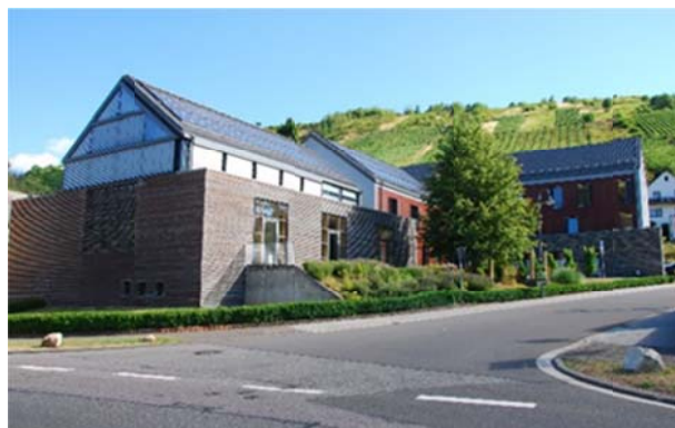
Abb.8: Verwaltungsgebäude, Verbandsgemeinde Ruwer

Die Verbandsgemeinde Ruwer (Abb. 8) hat ihre politische Verantwortung zur Erreichung der Klimaschutzziele wahrgenommen und setzt seit Jahren im öffentlichen Auftrags- und Beschaffungswesen auf den Klimaschützer Holz. Mit insgesamt sieben eingereichten Einzelprojekten zeigt die Verbandsgemeinde, wie vielfältig Holz zum Bauen und Wohnen eingesetzt werden kann. Umweltministerin Ulrike Höfken und die Wettbewerbsjury bedankten sich dafür bei der Verbandsgemeinde mit Warengutscheinen der Unternehmen Elka und Megawood im Gesamtwert von 5.000 Euro.