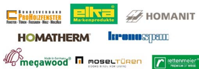
Abb. 4: Die Sachpreise wurden von Unternehmen der Holzwirtschaft zur Verfügung gestellt.

Unternehmen der Holzverarbeitenden Industrie stellten in diesem Jahr Sachpreise im Gesamtwert von 20.000 Euro zur Verfügung (Abb. 4). Besonderer Dank geht an die Unternehmen Elka, Homanit/Homatherm, Kronospan, Megawood, Mosel Türen und Rettenmeier sowie an den Bundesverband ProHolzfenster.