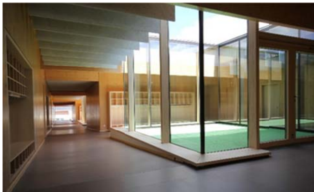
Abb. 5: Erster Preis: Kita Bunte Töne – Lichthöfe, Stadt Alzey Foto: AV1 Architekten GmbH

Kita „Bunte Töne“ und „Hanni Kipp - Haus des Kindes“