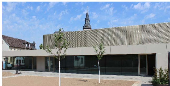
Abb. 10: Dorfgemeinschaftshaus, Ortsgemeinde Dirmstein

Der Neubau des Dorfgemeinschaftshauses in Dirmstein (Abb. 10) zeigt beispielhaft, wie durch die Verwendung von Holz ein nachhaltiges, ressourcenschonendes und energiesparendes Gebäude geschaffen werden kann. Das Holzgebäude ist ein kompletter Holzmassivbau aus Brettsperrholzelementen und bindet über 342 Tonnen CO 2 .