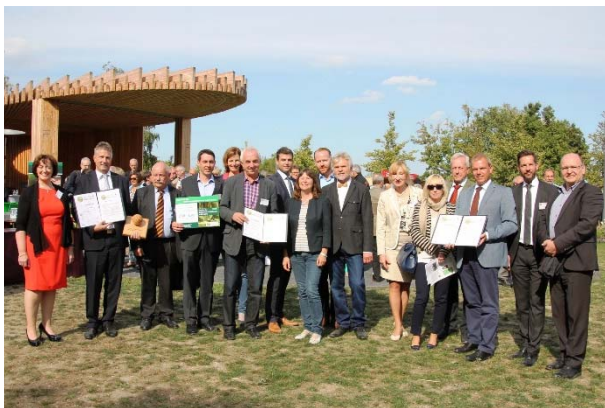
Abb. 1: Umweltministerin Ulrike Höfken gemeinsam mit den Preisträgern 2015

Von Februar bis Juni 2015 veranstaltete die Initiative HolzProKlima unter der Schirmherrschaft der rheinland-pfälzischen Ministerpräsidentin Malu Dreyer nach den positiven Erfahrungen aus dem letzten Jahr in Nordrhein-Westfalen den Kommunalwettbewerb HolzProKlima in Rheinland-Pfalz. Gesucht wurden Städte, Gemeinden und Landkreise, die den wertvollen Roh-, Werk-, und Baustoff Holz bewusst zur Reduktion des klimaschädlichen Treibhausgases CO 2 einsetzen. Insgesamt gingen 38 Bewerbungen beim Wettbewerbsbüro ein, aus denen eine Fachjury fünf Preisträger nominierte. Beim Online-Voting unter www.holzproklima.de wurden rund 13.000 Stimmen abgegeben. Die feierliche Preisverleihung fand mit ca. 100 Gästen am 11.09.2015 auf der Landesgartenschau in Landau statt. Die rheinland-pfälzische Umweltministerin Ulrike Höfken ehrte die Preisträger persönlich (Abb. 1).